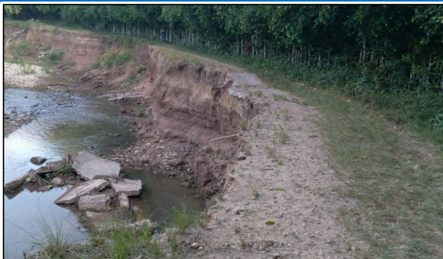
FOTOGRAFIA N°01: CAUCE DEL RIO COLMATADO Y EROSIONANDO EN RIBERA