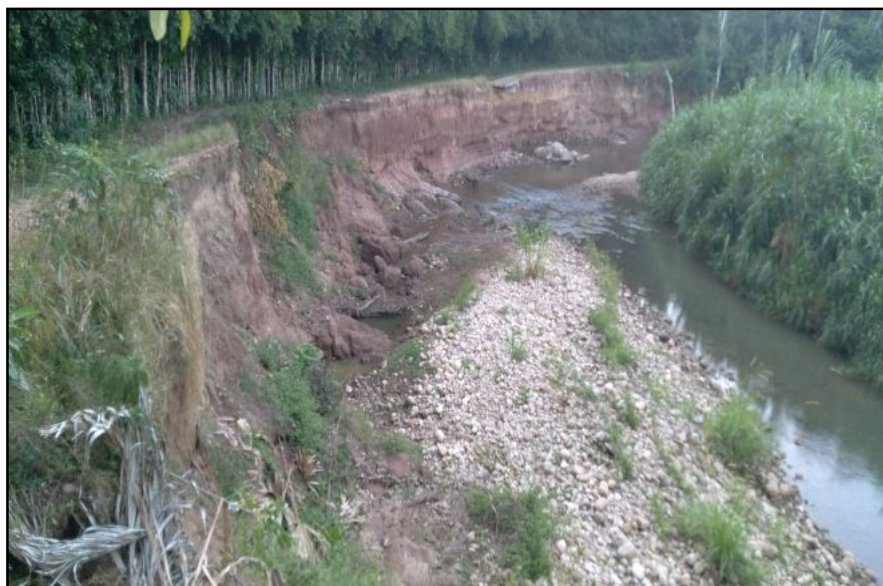
FOTOGRAFIA N°02: IDENTIFICACIÓN DE PUNTOS CRITICOS EN LA QUEBRADA PUCAYACU PARA REALIZAR TRABAJOS DE